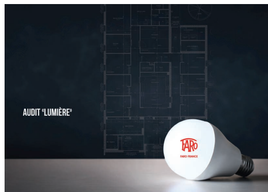
Audit Lumière projet global EXTRAIT CABINET COMPLET